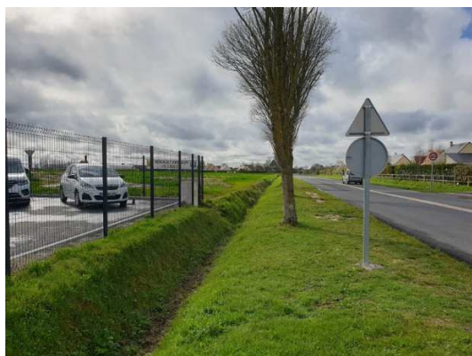
Vue sur le fossé le long de l'Avenue des Canadiens, au droit du garage Renault