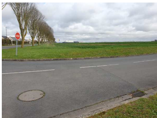
Vue sur une grille avaloir au niveau de la Rue Guy de Maupassant