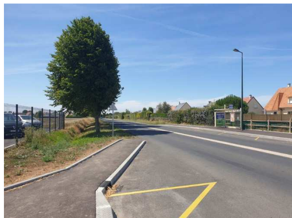
Vue sur les arrêts de bus existants Avenue des Canadiens