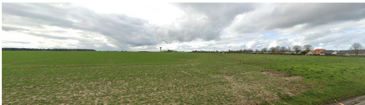
Vue depuis la RD n°93, vers l'Ouest (absence du garage et du Carrefour Contact sur la photographie)