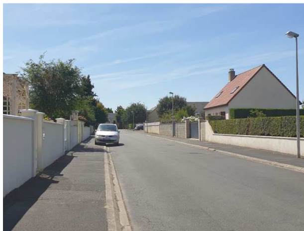
Vue sur la Rue Guy de Maupassant