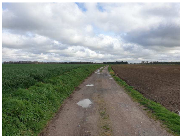
Vues sur le chemin rural existant entre la zone d'activités et le terrain de sport, représentant une barrière topographique et hydraulique