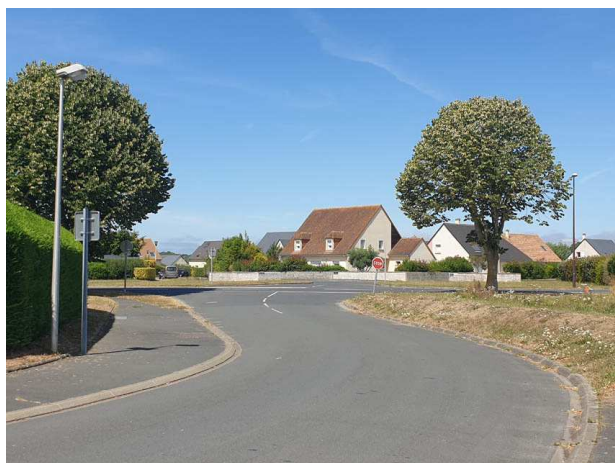
Vue sur le carrefour entre la Rue Guy de Maupassant et l'Avenue des Canadiens