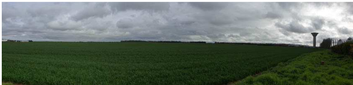
Vue sur le Sud-Est