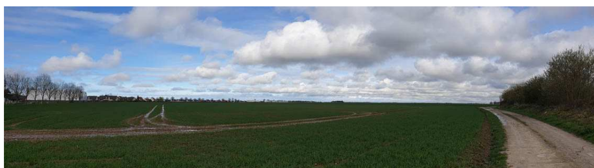
Vue sur le bassin versant amont collecté par le projet d'habitat