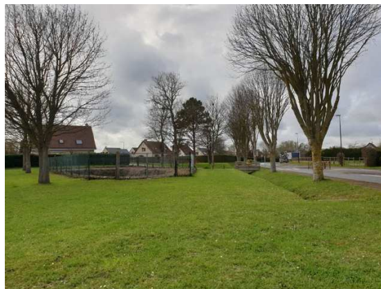
Vue sur le fossé et un bassin de rétention des eaux pluviales