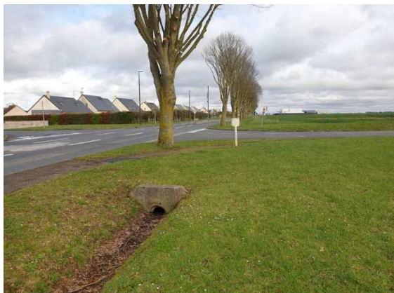
Vue sur le fossé existant le long de l'Avenue des Canadiens, en aval de la zone d'étude