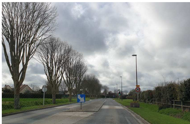
Vue sur l'Avenue des Canadiens, vitesse limitée à 30 km/h