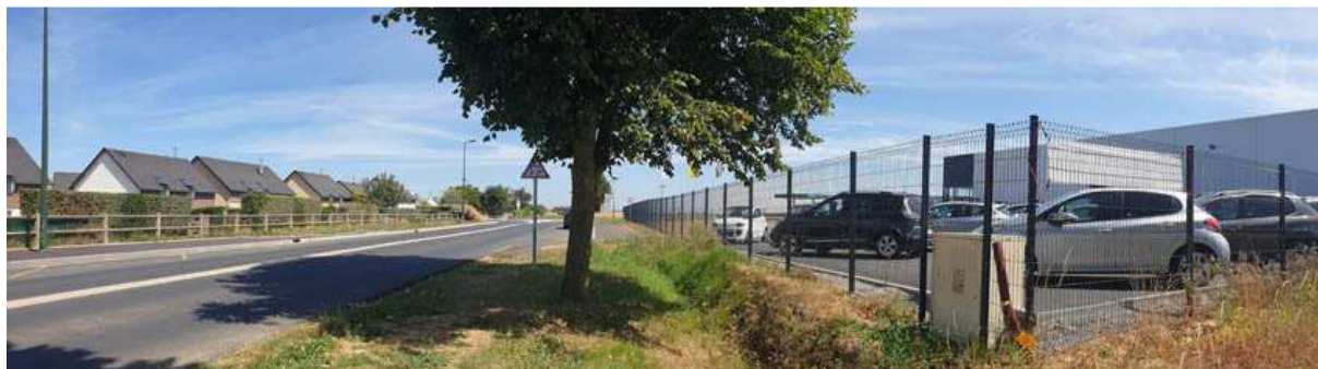
Vue sur le garage existant et le rond-point entre l'Avenue des Canadiens et la RD n°93