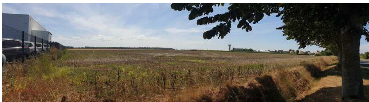
Vue vers le Sud-Ouest, depuis le garage existant le long de l'Avenue des Canadiens