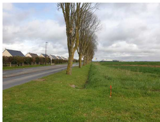
Vue sur le fossé existant le long de l'Avenue des Canadiens