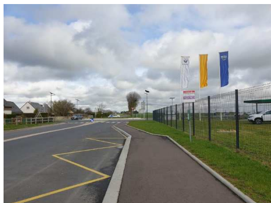
Vue sur le giratoire, intersection de la RD35 et la RD93