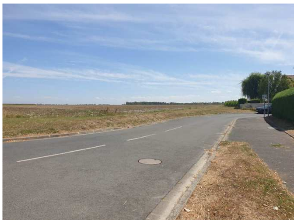
Vue vers la Rue Guy de Maupassant depuis l'Avenue des Canadiens