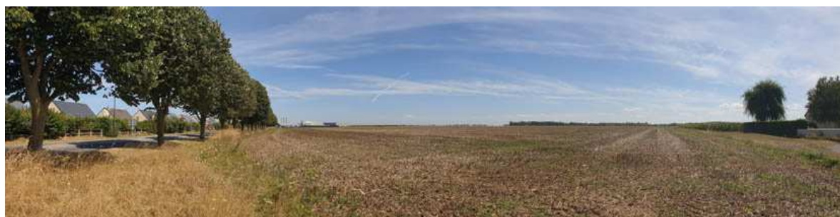
Vue vers le Sud