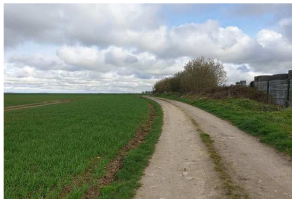
Vue sur le chemin rural existant entre la zone d'activités et le terrain de sport, représentant une barrière topographique et hydraulique