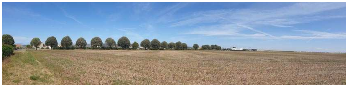
Vue vers le Nord-Est