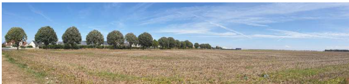
Vue vers le Nord-Est depuis la Rue Guy de Maupassant