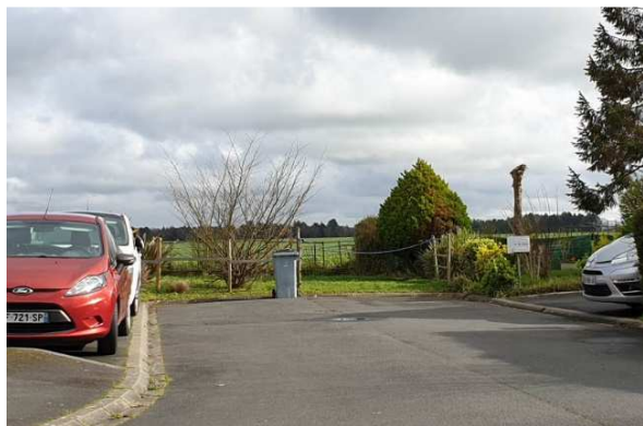
Vue sur une future connexion entre le lotissement existant Rue Guy de Maupassant et le futur lotissement Le Grand Clos 2