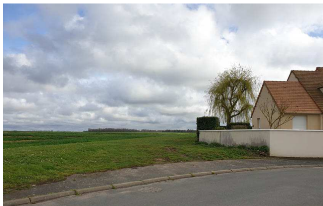
Vue sur le Chemin rural existant, situé entre les deux futurs lotissements