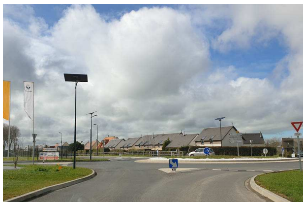
Vue sur le giratoire depuis la RD93