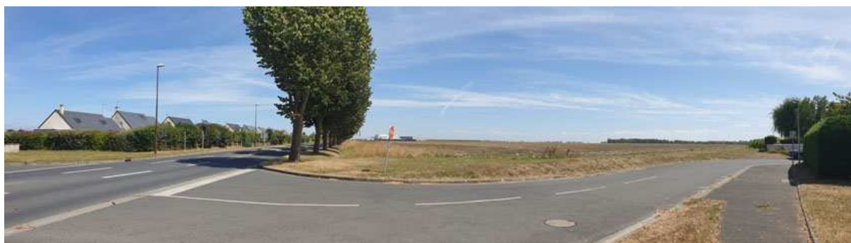
Vue vers l'Est