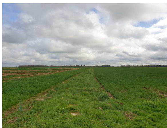
Vue sur le Chemin rural situé à la limite entre les deux futurs lotissements