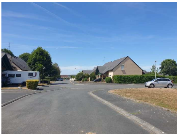
Vue sur le lotissement existant à l'Ouest et la Rue Guy de Maupassant