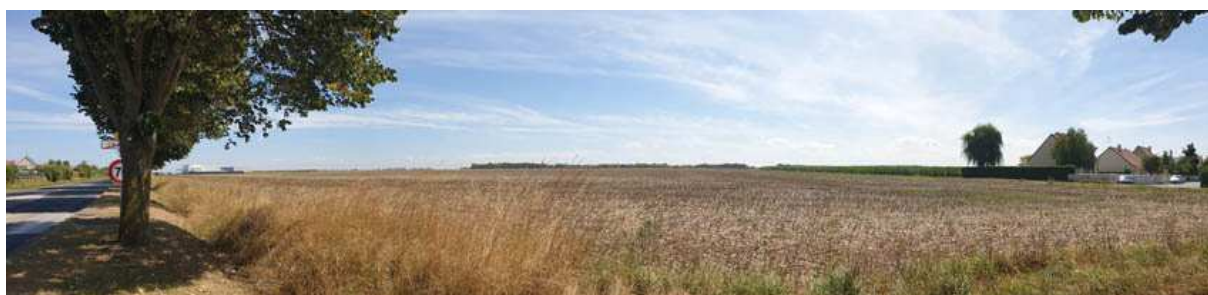
Vue vers le Sud, depuis l'Avenue des Canadiens