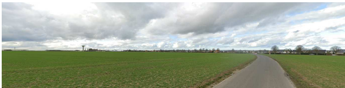
Vue lointaine vers le Nord-Ouest, depuis la RD n°93