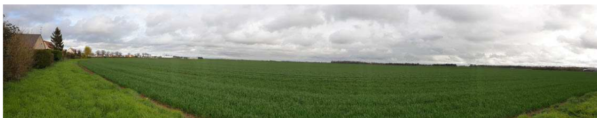
Vue vers l'Est depuis les habitations existantes le long de la Rue Guy de Maupassant