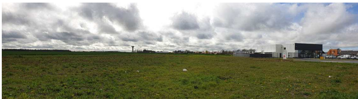
Vue lointaine à partir de la RD n°93, vue sur le garage Renault