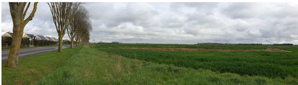
Vue vers l'Est, depuis l'angle de l'avenue des Canadiens et la Rue Guy Maupassant