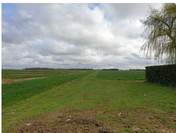
Vue sur le Chemin rural situé à la limite entre les deux futurs lotissements