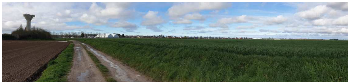
Vue sur le chemin rural existant – vue sur le talus surélevant le terrain (barrière topographique et hydraulique)