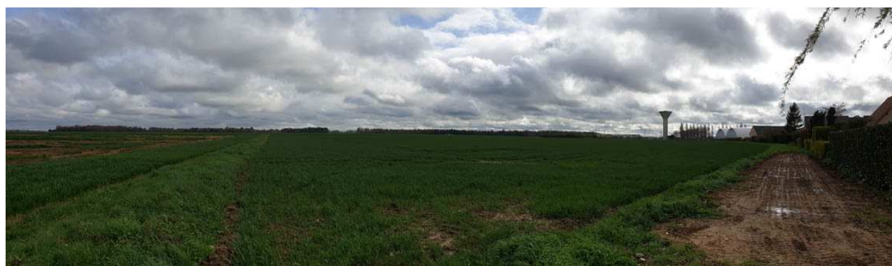
Vue sur le terrain concerné par le futur lotissement Le Grand Clos 2, vers le Sud