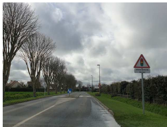
Sur l'Avenue des Canadiens vers l'Ouest